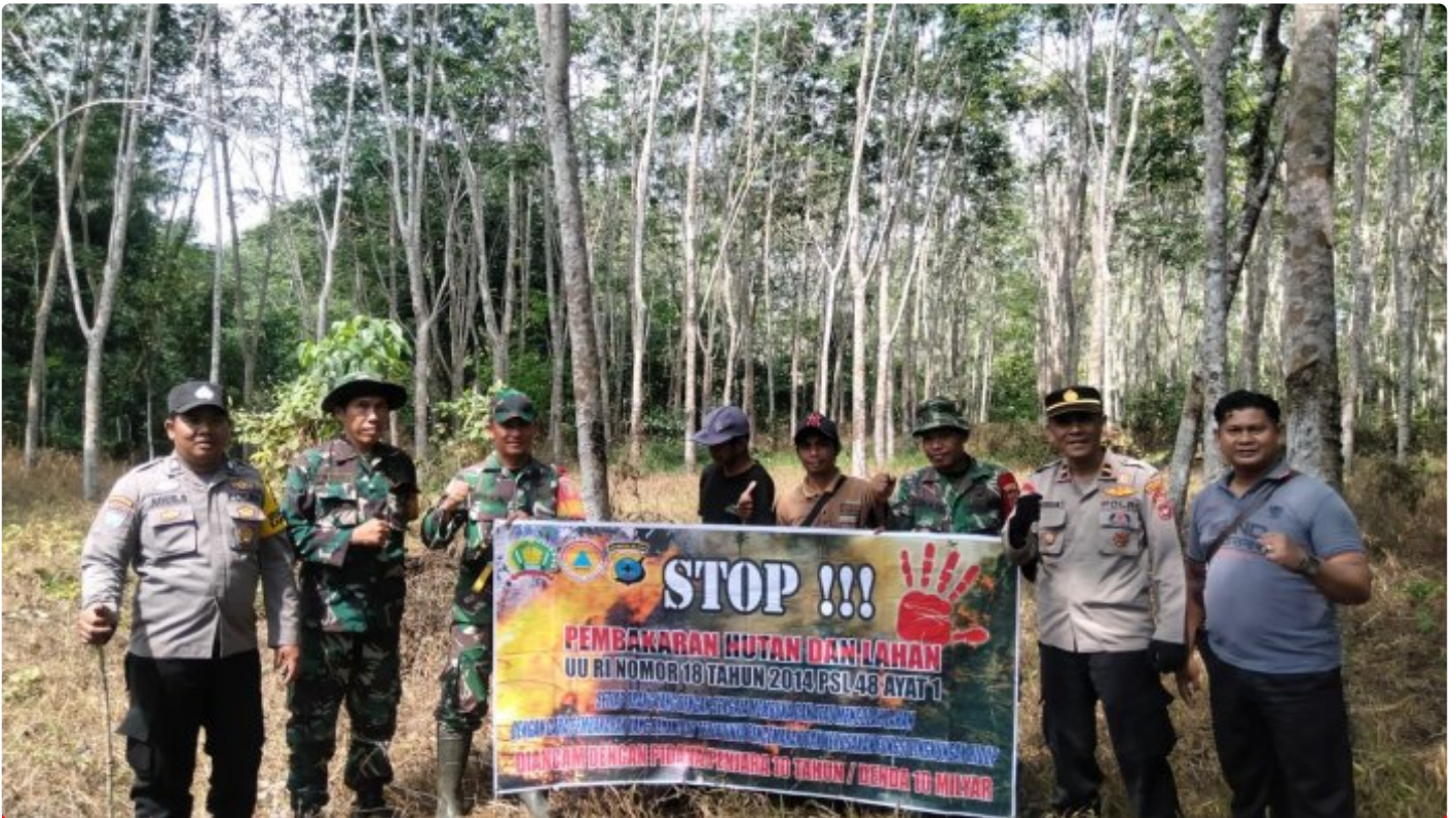
Personel Gabungan HST Lakukan Patroli dan Sosialisasi Cegah Karhutla

BARABAI-Masih maraknya hotspot dan dan terjadi kebakaran lahan, Aparat Gabungan TNI-Polri, BPBD HST, Manggala Agni, Relawan dan masyarakat melaksanakan patroli cegah karhutla.Selasa (22/08/2023).